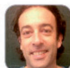
José Antonio Labarra Pérez Secundaria - Tenerife