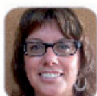
Morovillas Hernández Castro Secundaria - Tenerife