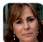
Mª Concepción Martín Lorenzo Primaria - Tenerife