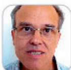
Máximo L. Galdán Miranda Primaria - Tenerife