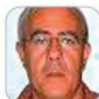
Cebo Díaz Hernández Secundaria - Tenerife