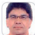
Guillermo Rdez Delgado Secundaria - La Palma