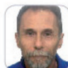
José Enrique Martín Santana Primaria - Tenerife