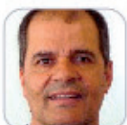
Pedro Brito Francisco Secundaria - Tenerife