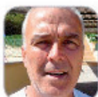
Zacarías Fortín Castellano Primaria - Tenerife