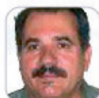
Juan Ramón Álvarez Castañedo Primaria - Tenerife