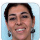
Mª Teresa Glez Del Rosario Primaria - Tenerife