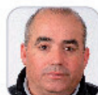
A. Vicente Glez Galdán Primaria - La Gomera