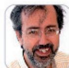
Miguel Ángel Reyes Pérez Secundaria - Tenerife