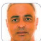
A. Carlos Pedraza Sánchez Primaria - Tenerife