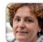
Inés Domínguez Correa Secundaria - Tenerife