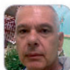
Otto José Ramos Morales Primaria - Tenerife