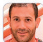
Manuel J. Rodríguez García Secundaria - Tenerife