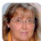
Mª Isabel Iglesias Galazra Primaria - La Palma