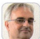
Miguel Ángel Ceballos Vazos Secundaria - Tenerife