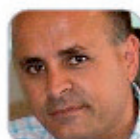
Enrique Borell Padrón Secundaria - Tenerife