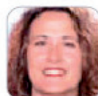
Bernardo Ramos Artiles Primaria - La Palma