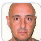
Serafin Fernández Martínez Primaria - Tenerife