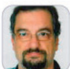
José Ignacio Alguero Cuervo Secundaria - La Gomera