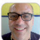
Manuel Batista García Secundaria - Tenerife