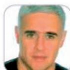
J. Antonio Marrique Cabrera Secundaria - Tenerife