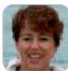
Victoria García Corp Secundario - Tenerife