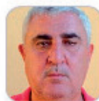
Enrique L. Alonso Álvarez Primario - Tenerife