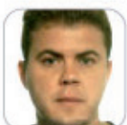
José Carlos Baudé Dario Secundaria - Tenerife