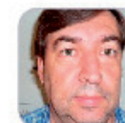
Emilio Antonio Verdú Afonso Secundaria - Tenerife