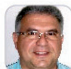
José Ramón Barroso Arteaga Secundaria - La Palma