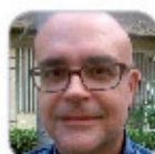
Moisés González de la Rosa Secundaria - Tenerife