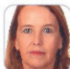
Juana Mª Bethencourt Soveredo Secundaria - La Gomera